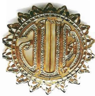
องค์การบริหารส่วนตำบล